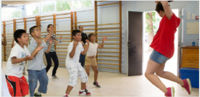
Notícies, descripcions, fotografies, material audiovisual i un mapa didàctic (Imatges: Arxiu)

juliol un nou espai cibernètic. Si hi accediu, podreu informar-vos sobre totes les activitats esportives i lúdiques que