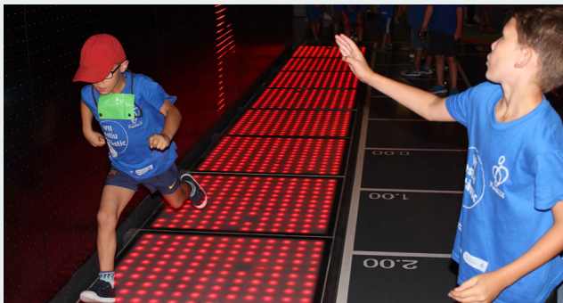
La prova de velocitat ha estat una de les més tastades al llarg de la setmana

1976, entre uns altres. Seguidament, els infants i joves de l'Estiu van divertir-se tastant una sèrie de màquines que va posar a provar la seva capacitat de reflexos, salt d'alçada i velocitat. Finalment, van visionar una projecció sobre l'origen i les grans disciplines de l'esport, que finalitzava amb una idea prou interessant: tots nosaltres, petits i grans, formem part del món de l'esport i el fem créixer amb la nostra activitat.