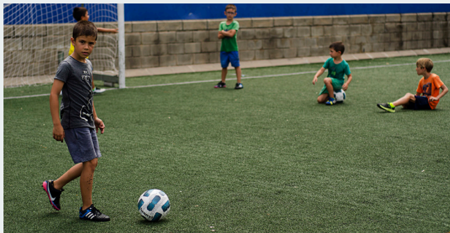
Després d'una intensa jornada esportiva, els participants necessiten una estona de repòs

aportar coneixements a petits i grans sobre el món de l'esport, des del punt de vista del joc net, la inclusió i la igualtat entre esportistes de tota mena.