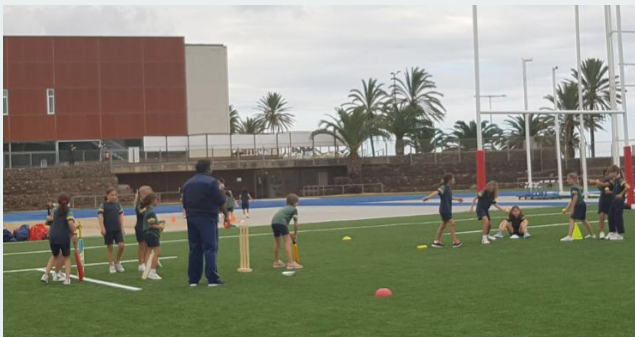
El CEM La Mar Bella és un dels espais idonis per acollir activitats d'aquest projecte

LA INTERCULTURALITAT I LA IGUALTAT A TRAVÉS DE L'ESPORT SÓN CONCEPTES IMPORTANTS D'AQUESTA INICIATIVA SOCIAL